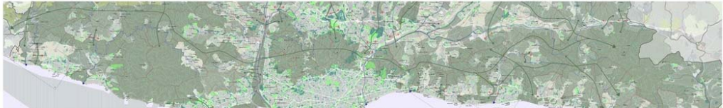
Sessió 3. Temes recurrents, i noves demandes; nous vectors del projecte de ciutat contemporània