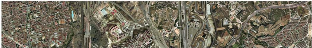
Sessió 2. La formació metropolitana de la RMB i els elements clau actuals per un projecte renovat de la metròpoli